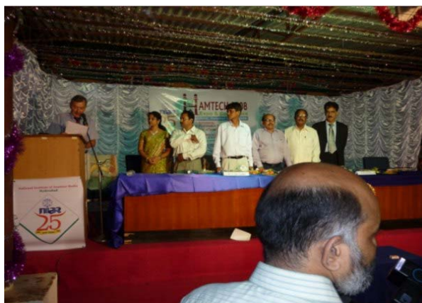
DL9GFB beim Verlesen der GDXF-Grußbotschaft

ebenso im Blickpunkt wie der Betrieb von und über Satelliten. Die Gäste - Funkamateure und Funkinteressierte – kamen aus ganz Indien und verfolgten mit großem Interesse das gebotene Programm. Zu einem besonderen Höhepunkt gestaltete sich die Übergabe von ca. 15 QRP-SSB-Einbandtransceivern an Vertreter verschiedener Schulen und Pfadfinderorganisationen dieses großen Landes.